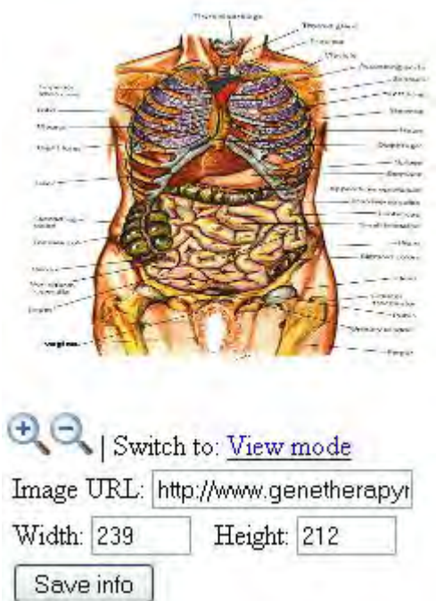
Figura 1. Unealta ImageViewer în modul editare – versiunea 1

În figura 1 am prezentat o versiune a unelei ImageViewer din perspectiva autorului (în modul editare), iar în figura 2 am prezentat aceeași unealtă din aceeași perspectivă, dar interacțiunea cu formularul de editare se face diferit, astfel că acest formular nu mai este vizibil imediat sub unealtă. În schimb poate fi făcut vizibil cu un click dreapta al mouse-ului și făcut invizibil prin click în orice altă parte a unelei. Prin această metodă nu numai că am redus spațiul ocupat de unealtă, ci am îmbunătățit și maniera de schimbare între modurile editare și vizualizare. În timp ce în figura 1 autorul trebuia să schimbe între modurile de vizualizare printr-un click pe linkul corespunzător, în figura 2 autorul interacționează cu unealta într-o manieră WYSWYG (What You See is What You Get), nefiind necesare mișcări de interacțiune suplimentare pentru schimbarea între moduri. În cazul figurei 2, formularul de editare apare din punctul unde se dă click cu mouse-ul, acesta putând fi suprapus complet peste imagine sau poziționat aproximativ în afara imaginii pentru a putea păstra contactul vizual și cu imaginea.