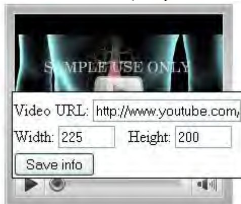
Figura 3. Unealta VideoViewer în modul editare

Figura 3 prezintă unealta numită VideoViewer , folosită pentru vizualizarea unui filmuleț. URL-ul video-ului poate fi fie al unui filmuleț de pe site-ul youtube.com , caz în care unealta construiește codul embed corespunzător pentru player-ul youtube , fie al unui filmuleț de pe un server, caz în care unealta folosește media player-ul default în care include filmulețul respectiv.