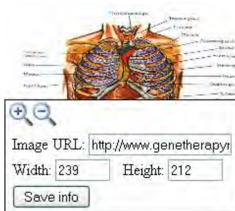
Figura 2. Unealta ImageViewer în modul editare – versiunea 2

Între cele două versiuni de unealtă prezentate mai sus, se vede clar că a doua este superioară din punct de vedere al utilizării spațiului disponibil. În plus, după cum vom arăta mai jos în lucrare, se îmbunătățește considerabil și modul de interschimbare între modurile editare și vizualizare ale instanței.